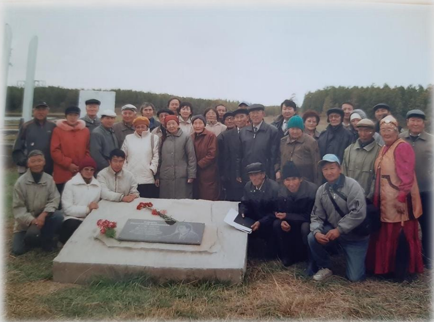
Родственники художника на открытии памятника, посвященного художнику