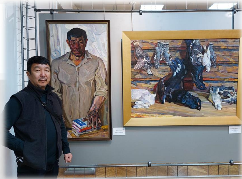
Сын Иннокентия Дмитриевича на выставке своего отца